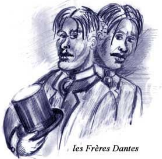
les Frères Dantes

Ce sont les frères DANTES qui sont derrière ces intimidations : pas très futés et un peu brusques, ils veulent écarter de leur chemin les inopportuns. Les métis boivent beaucoup et cherchent à intimider Arsène en jouant les durs, bien qu'il soit écarté de leur liste de suspects car ils l'on déjà interrogé une nuit, le visage masqué. Dans leur logique, les joueurs sont de trop et ils vont les défier au bras de fer, à qui